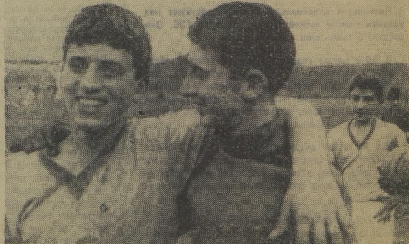
И побеждая и проигрывая, мы остаёмся друзьями.