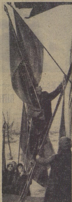
Праздник. На каждом доме — флаги. А здесь их — пятнадцать! В честь всех друзей из всех союзных республик.